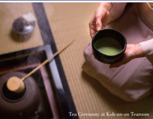
Tea Ceremony at Koh-un-an Tearoom