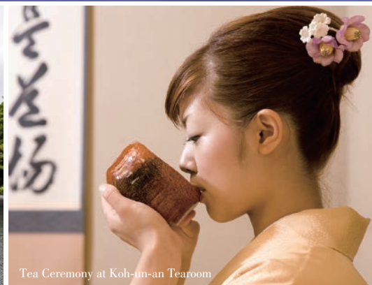
Tea Ceremony at Koh-un-an Tearoom